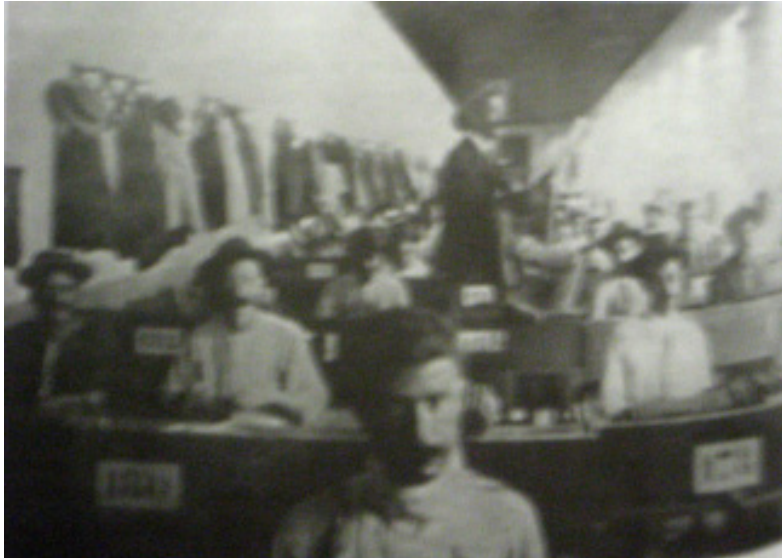
Lectura en una fábrica de tabaco.