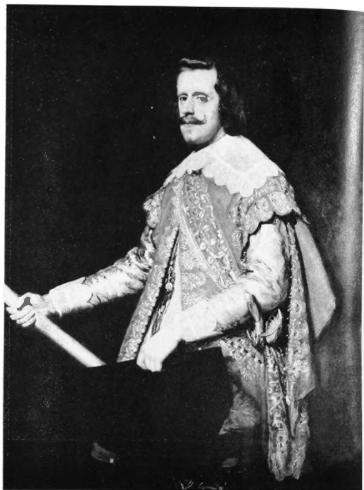
Felipe IV, en Fraga. Colección Frick, Nueva York.