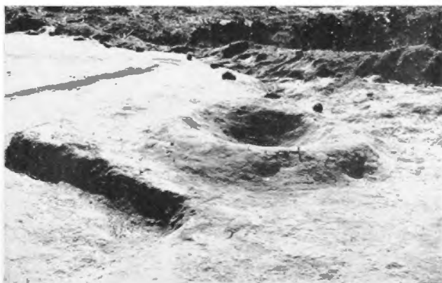
Uno de los braseros de uno de los templos que existieron sobre el Montículo 6 de Huapalcalco. Ante ese brasero deben haberse hecho ceremonias rituales.