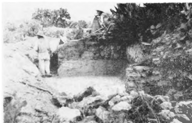
Uno de los aposentos del Templo C, hoy día casi totalmente destruido por un vecino de Huapalcalco, quien construyó con sus piedras, un machero sobre uno templo teotihuacano.