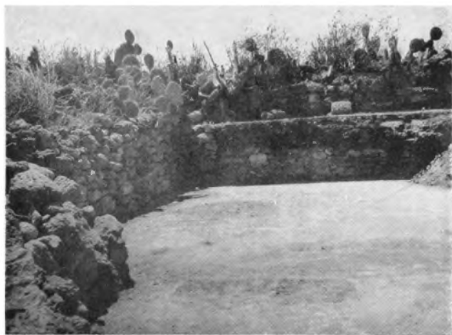
Ángulo sureste del Templo A, desgraciadamente, convertido hoy día en machero por la ignorancia del propietario del terreno en que se levanta esta venerable reliquia.