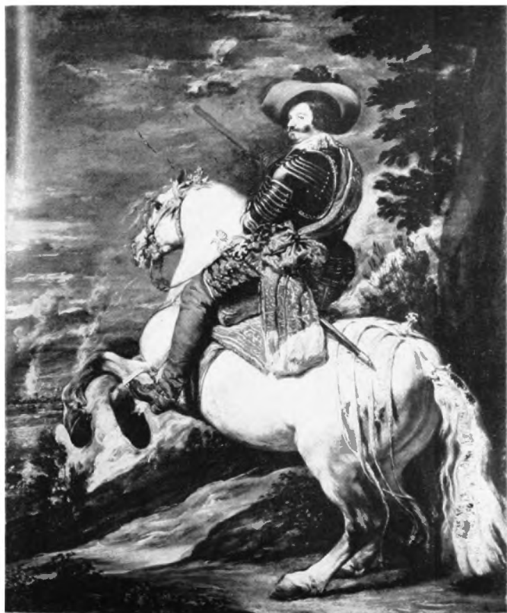
El Conde Duque de Olivares. Fundación Fletcher.