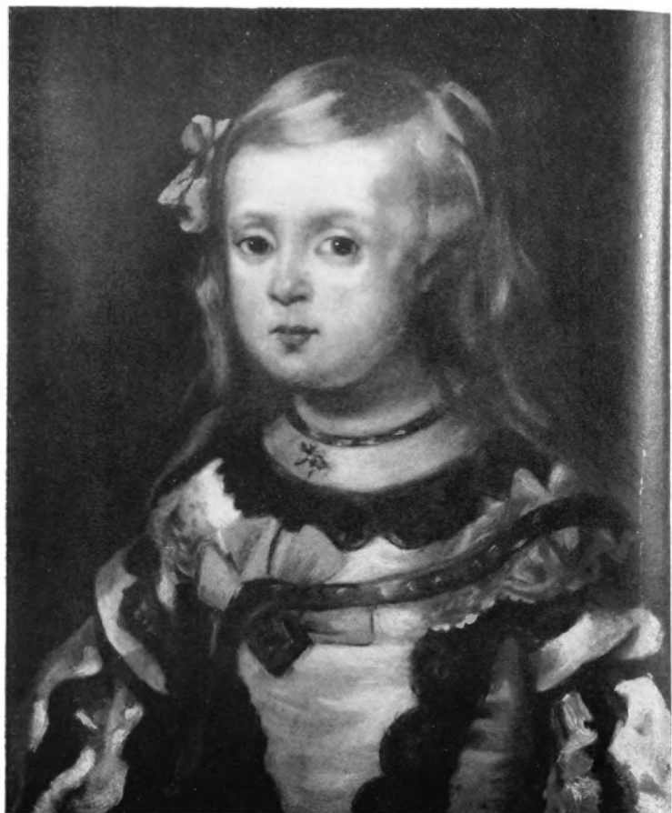
La Infanta Margarita.