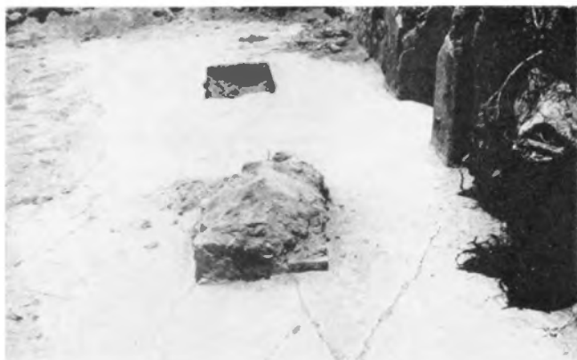
Vestibulo del Templo B, que muestra claramente las huellas de implantación de dos pilares rectangulares de sección rectangular. A la derecha, la puerta, con r.chetas algo salientes.