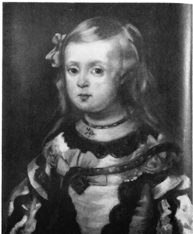
La Infanta Margarita.