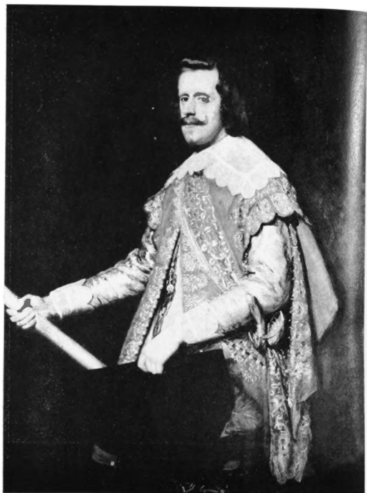
Felipe IV, en Fraga. Colección Frick, Nueva York.