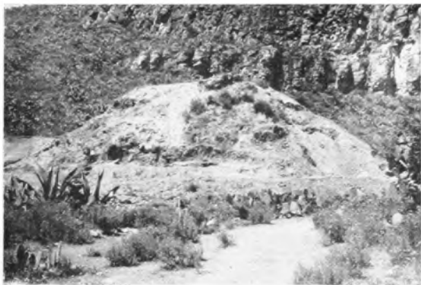
Montículo 6 de Huapalcalco, visto por el lado poniente. Es uno de los monumentos más importantes, no sólo de la región de Tulancingo, sino de todo el centro de México.