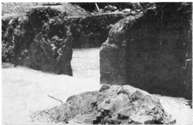
Parte del vestibulo, y puerta del Templo B, de estilo teotihuacano, el cual, al parecer, fue levantado sobre las ruinas de un edificio de la edad arcaica.