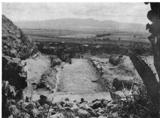
A la izquierda, parte de la Pirámide 6 de Huapalcalco, la cual fue construida hace unos 22 siglos. Adosada a ella se ve una construcción, acaso de estilo teotihuacano.