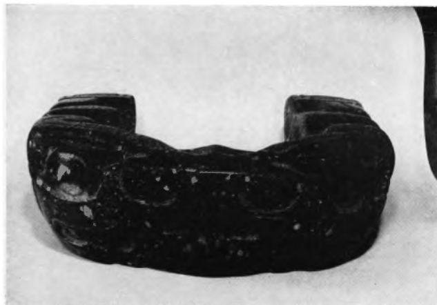
Yumu de durísima piedra verde encontrado en Huapalcalco, y, a lo que se cree, labrado por gente de cultura teotihuacana que hace unos quince siglos o más, vivió en ese lugar.