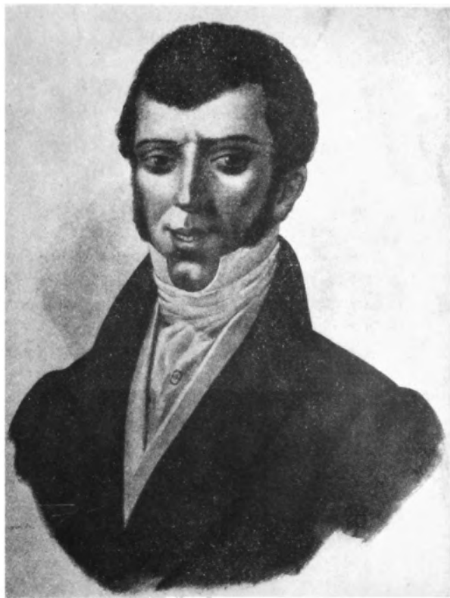
Manuel Eduardo de Gorostiza, en Londres.