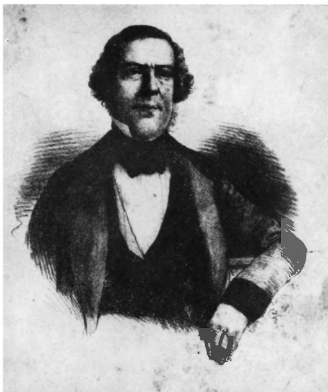
Manuel Eduardo de Gorostiza en sus últimos años, a fines de 1851.