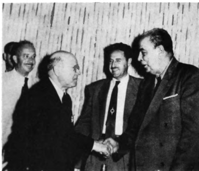
Casals y Gallegos. En el centro, el Gobernador del Estado de Veracruz.