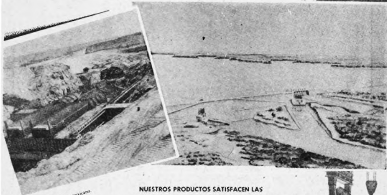
Obra de toma del lado mexicano. Vista hacia aguas abajo armazón de varilla corrugada.

NUESTROS PRODUCTOS SATISFACEN LAS NORMAS DE CALIDAD DE LA SECRETARIA DE LA ECONOMIA NACIONAL Y ADEMAS LAS ESPECIFICACIONES DE LA A. S. T. M.