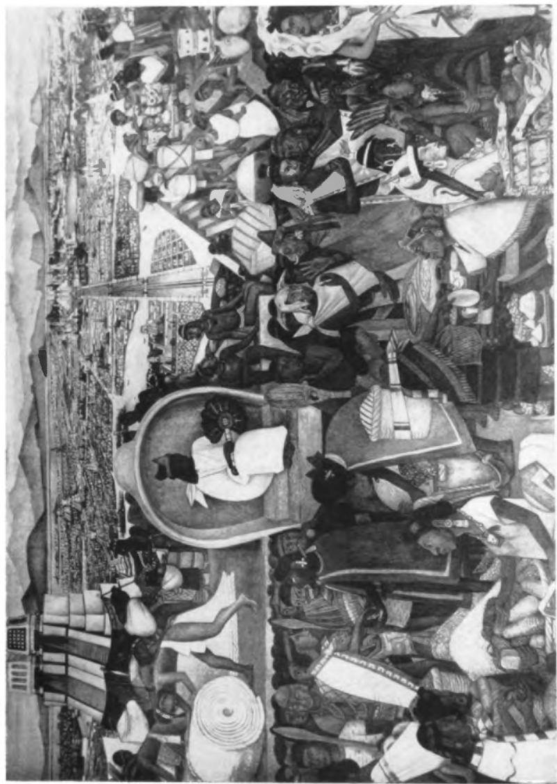
Tenochtitlán. Fresco de Diego Rivera en el Palacio Nacional de la ciudad de México.