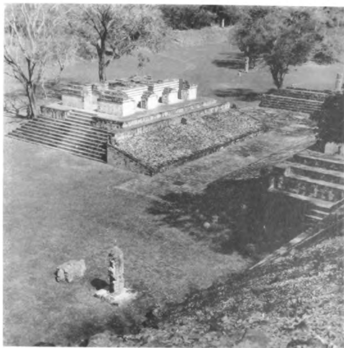
Juego de pelota.