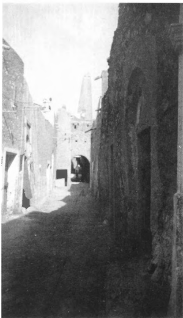
Una de las calles de la ciudad de Ghardaya, en el Mزاب, en cuyos muros del lado izquierdo pueden verse los alambres de la electricidad llevada por los franceses.