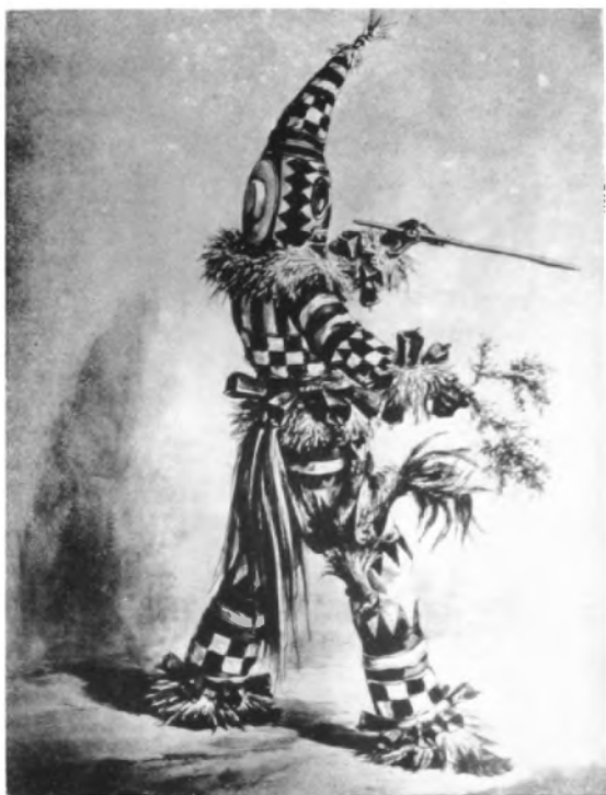
Un frime o diablito de los nãñigos de La Habana. (Estampa de Landaluce. Segunda mitad del siglo XIX).