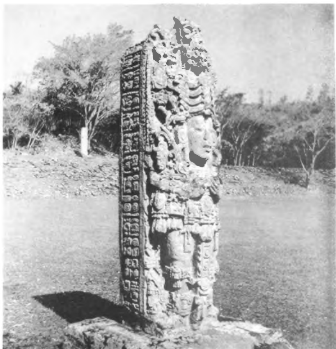
Estela B. Sabían calar la piedra y dar una sensación de ligereza.