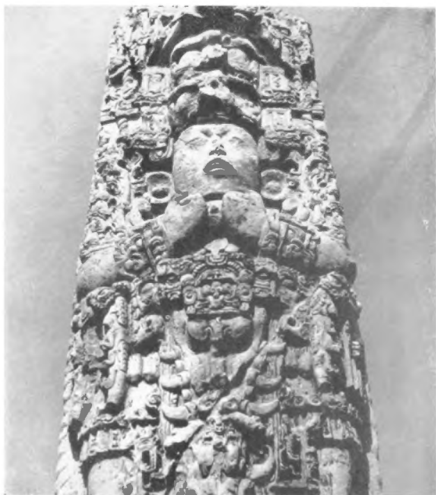
Estela C. Los ojos de un ver lejano.