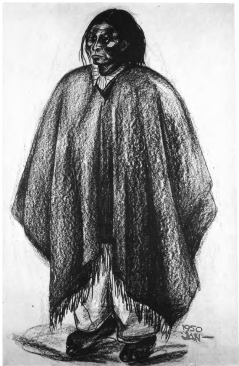
Indio. (Crayón, 1950).