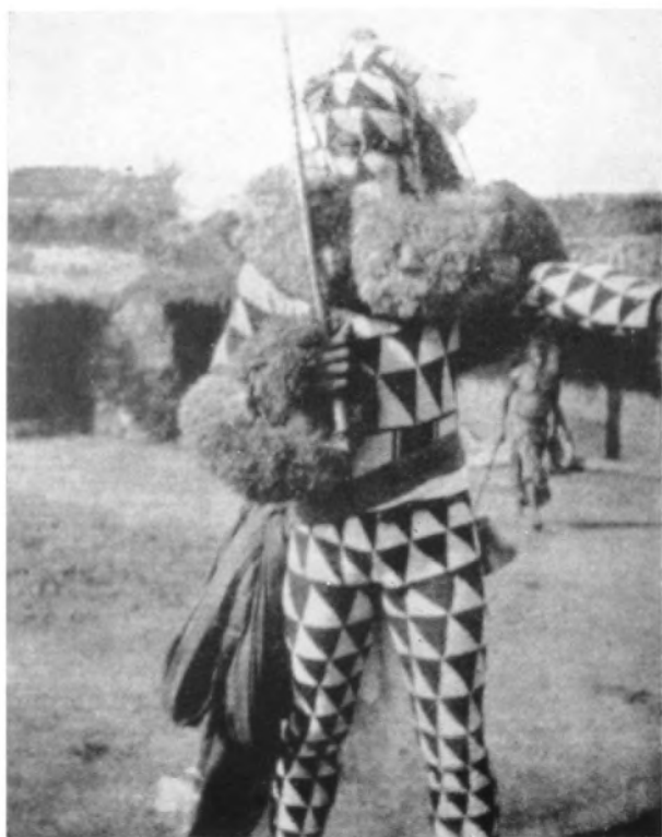
Fotografía de un oficiante enmascarado de la actual sociedad secreta de Ekue entre los negros ekoi y efik del África Occidental. (Foto de 1926).