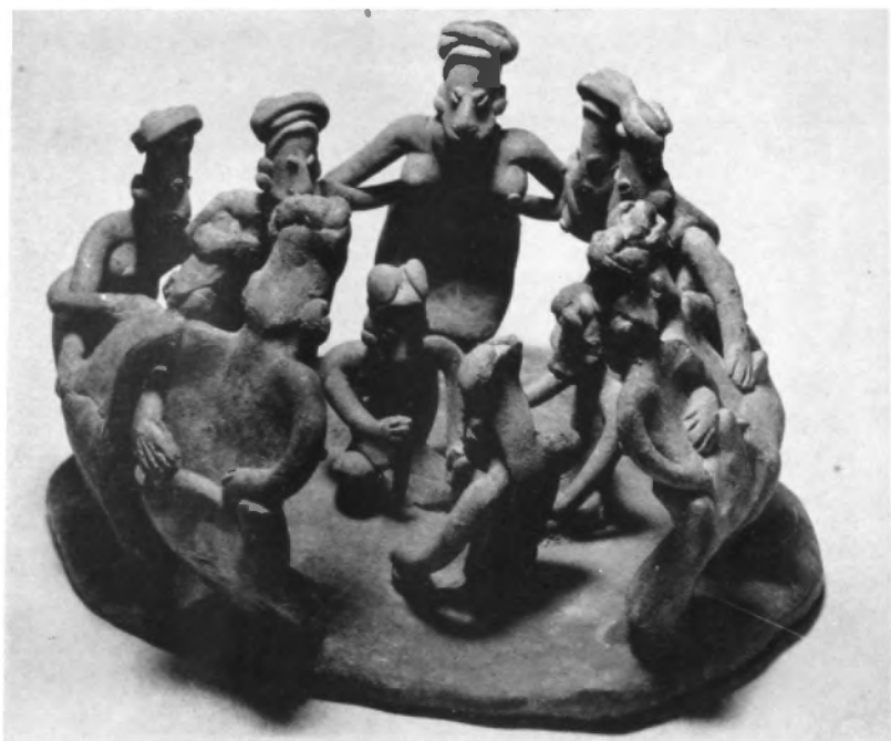
Danza de mujeres. Museo Nacional de Antropología, México, D. F.