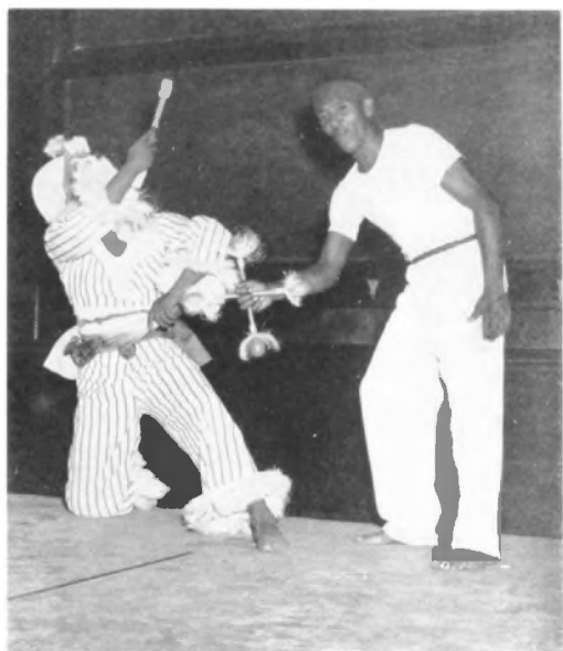
Un frime de los ñañigos en su pantomima, conducido por el morúa que suena el erikunde.