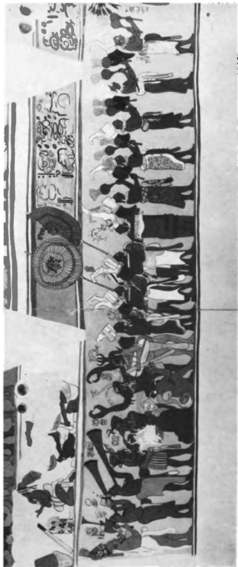
Frescos de Bonampak, Chiapas. (Copia de Agustín C. Villagra). Antiguo Imperio Maya 300-700 A. D. Museo Nacional de Antropología, México, D. F. Representación en pinturas policromadas de dieciséis músicos y danzantes mayas con lujosas máscaras y disfraces. Incluye ejecutantes del huehueltl, de conchas de tortuga percutidas con asta de ciervo y de sonajas simples y dobles.