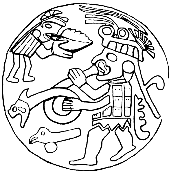
Trompeteros incas. Tocadores de trompetas de caracol y de barro, grabados en un ornamento de oro procedente de Trujillo, Perú.