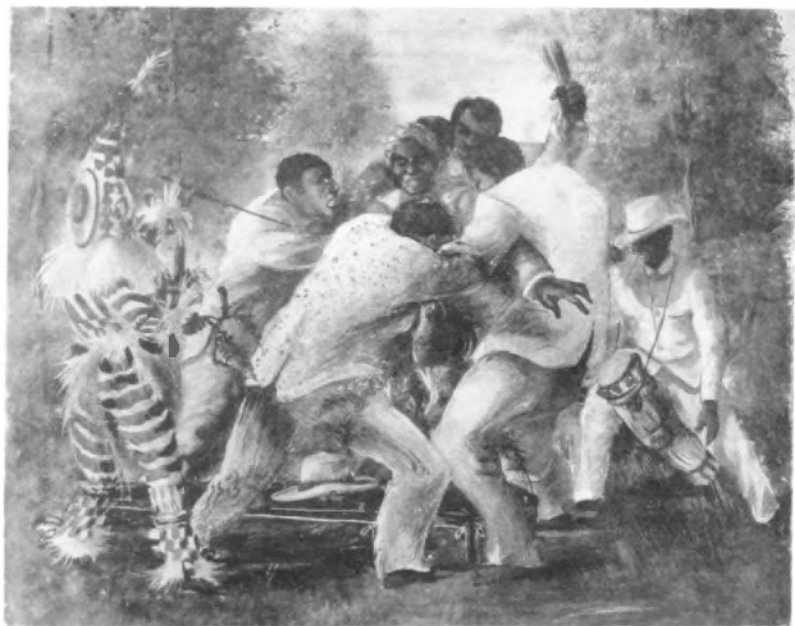
El írime rojo en el entierro de un iyamba o jefe de un juego de ñañigos. (Oleo de Landaluce, siglo XIX).