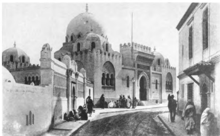
La Medersa o escuela superior islámica de Argel, donde la enseñanza es impartida con ayuda y bajo la vigilancia del Gobierno francés.