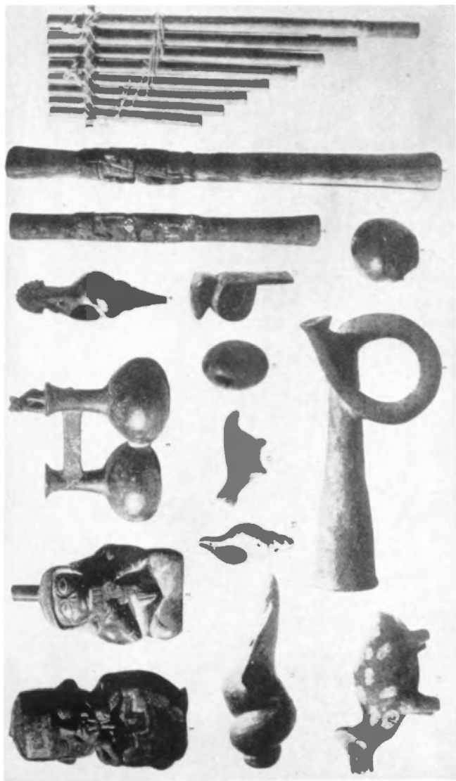
Instrumentos musicales peruanos. En la parte superior izquierda dos tocadores de antara, instrumento muy semejante a la flauta de Pan griega; en seguida un vaso silbador. Además, otros instrumentos: trompetas de caracol, recortas y una doblada, una flauta prehistórica, idéntica o casi idéntica a la flauta de Pan griega; silbatos y ocarinas. Tomado de "The Musical Instruments of the Incas", por Charles W. Mead.