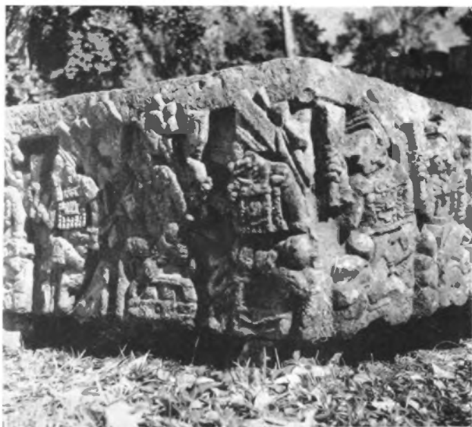
Altar Q. Dieciséis astrónomos arreglando el calendario.