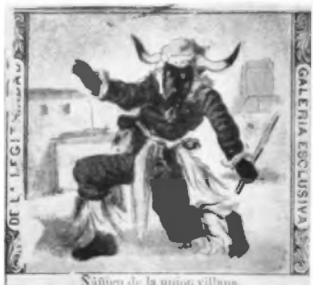
Ñáigos de la union villana.