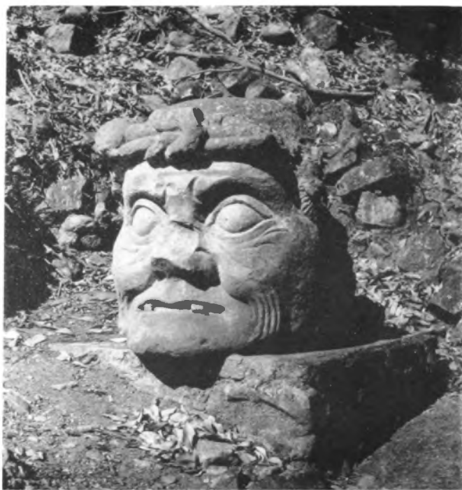
La cabeza perdida. Se ríe del tiempo y de nosotros.