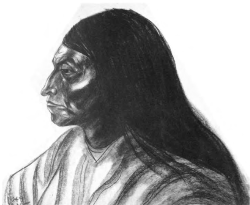
Cabeza de indio. (Crayón, 1949).