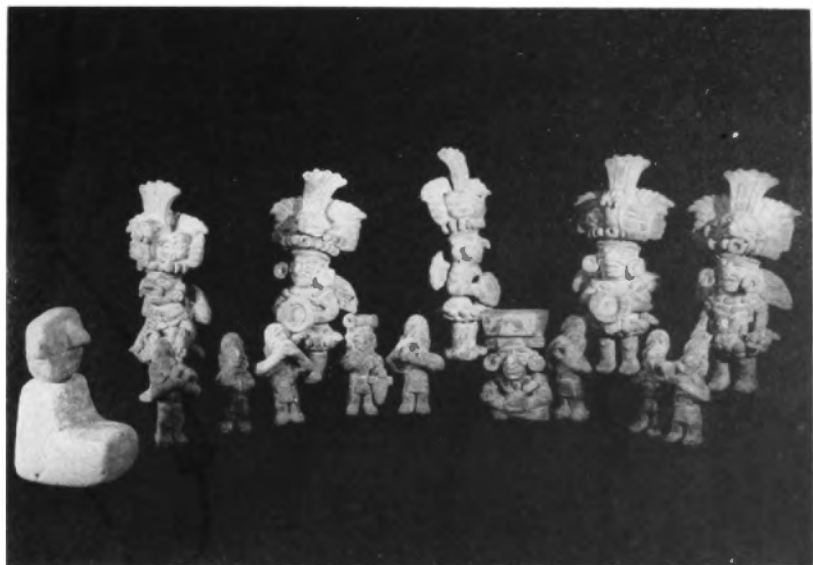
Danza fúnebre zapoteca. "El muerto aparece en forma de bulfo del cual emerge su cabeza. El dios del Fuego preside la escena. Los músicos forman un círculo. Los sacerdotes danzantes portan máscaras y espléndidos tocados con cabezas de aves y serpientes. Cultura Zapoteca. Procedencia: Monte Albán, Oaxaca". Museo Nacional de Antropología, México, D. F.