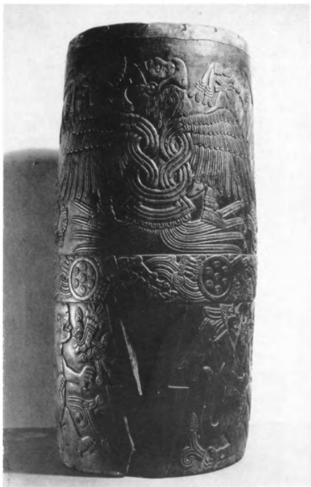
Panhueuetl de Malinalco. (Museo de Toluca). Construído de madera de sabino (ahueuetl), mide 98 cms. de altura, tiene arriba un diámetro de 42 cms. y en el centro, de muy visible convexidad, 52 cms.; el espesor de la pared es de 4 cms.