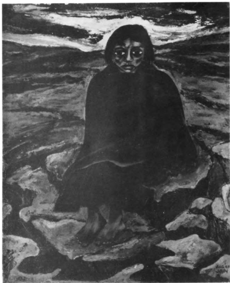
La víctima del terremoto. (Diego, 1949).