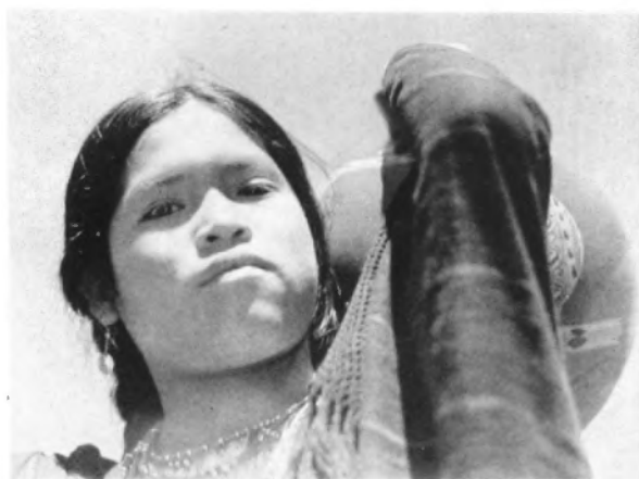
Arriba.—El . . . venía de una familia de alfareros. Abajo.—Ella . . . pequeña, redondita, suave.