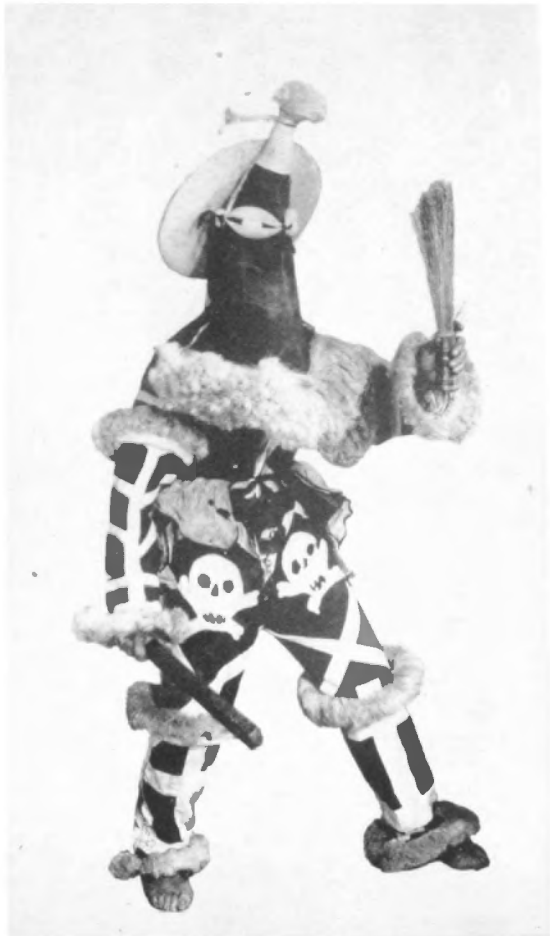
El irime denominado Anamangui, o irime funerario.