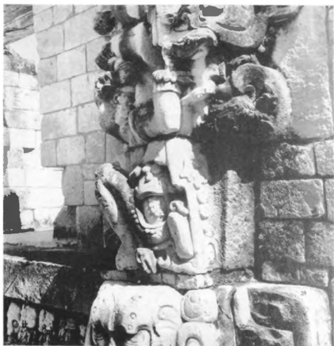
El esplendor barroco de la portada del santuario del Templo de la Meditación (Detalle).