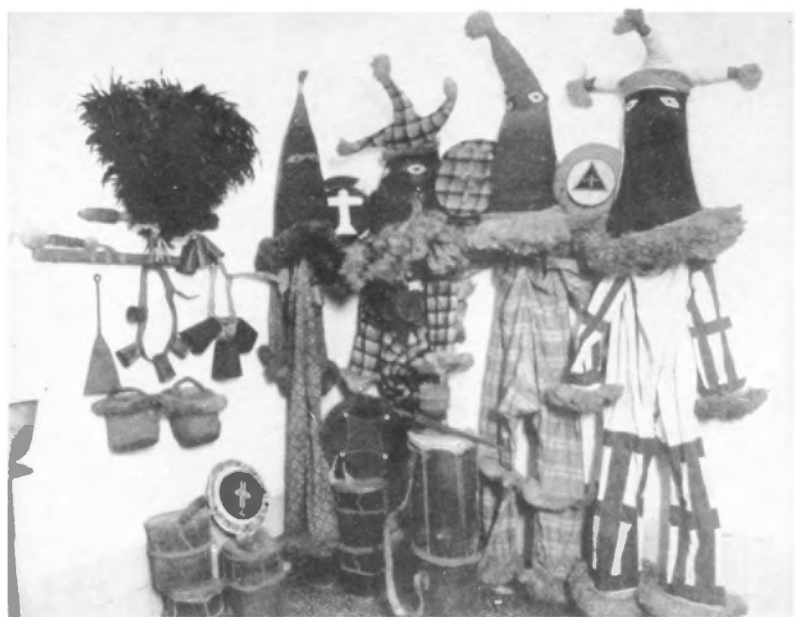
Vestidos de frime, sombreras, instrumentos musicales e insignias de los ñañigos.