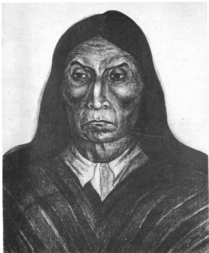
Cabeza de indio. (Crayón, 1950).