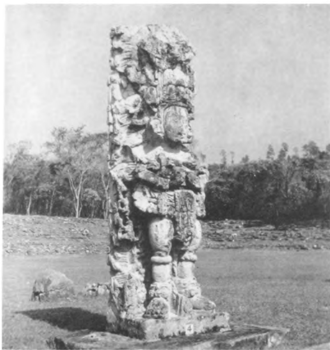
Estela 4. Vueltos de espaldas al ocaso.