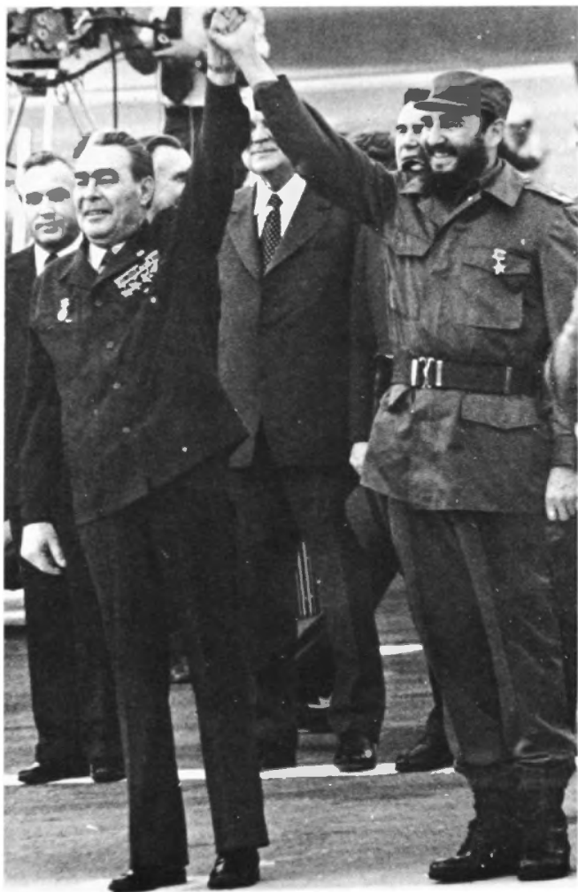
Brezhnev, y Castro se saludan..