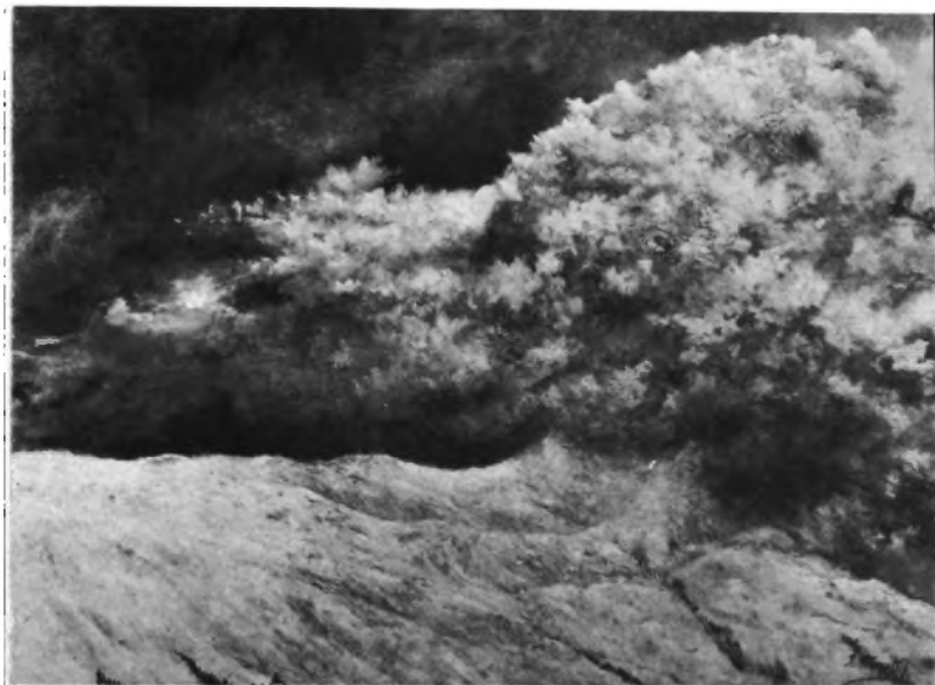
Tormenta de Nieve, Oleo