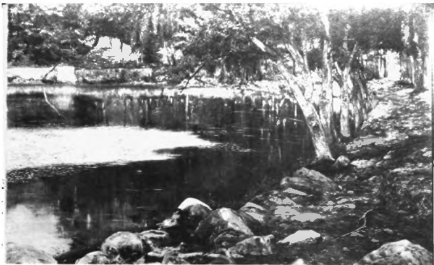
Las Fuente: Brotantes, Oleo sobre tela