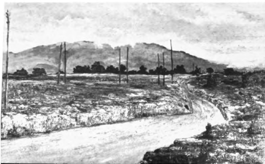
Camino de San Angel a Tlalpan, Oleo