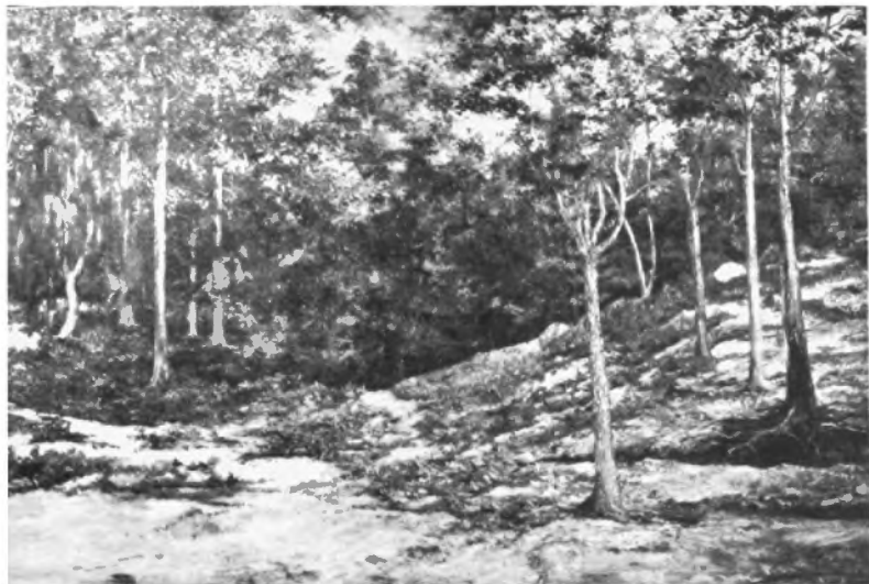
Tlalpan (Claro en el Bosque), Oleo sobre tela