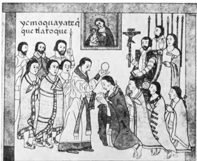
En el Lienzo de Tlaxcala dice: "Así fueron bautizados los caciques".