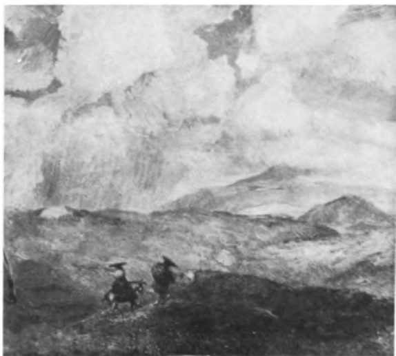
F. Cossio Paisaje en la Sierra