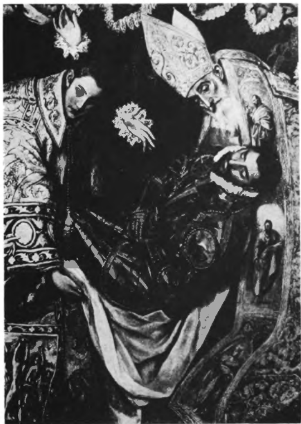
Greco: Enterramiento del Conde de Orgaz.