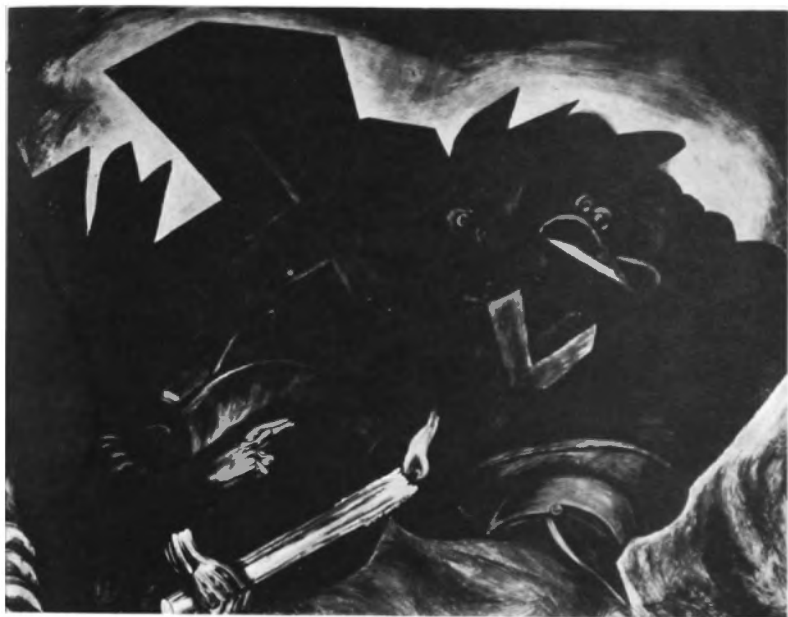
Orosco, fresco .

Quando los arzobispos bendicen el puñal y la pólvora y pactan con el sapo iscarriote y ladrón . . . ¿para qué quieren el salmo?