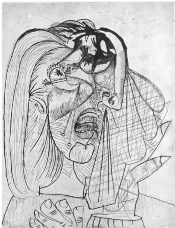
Grabado de Picasso.