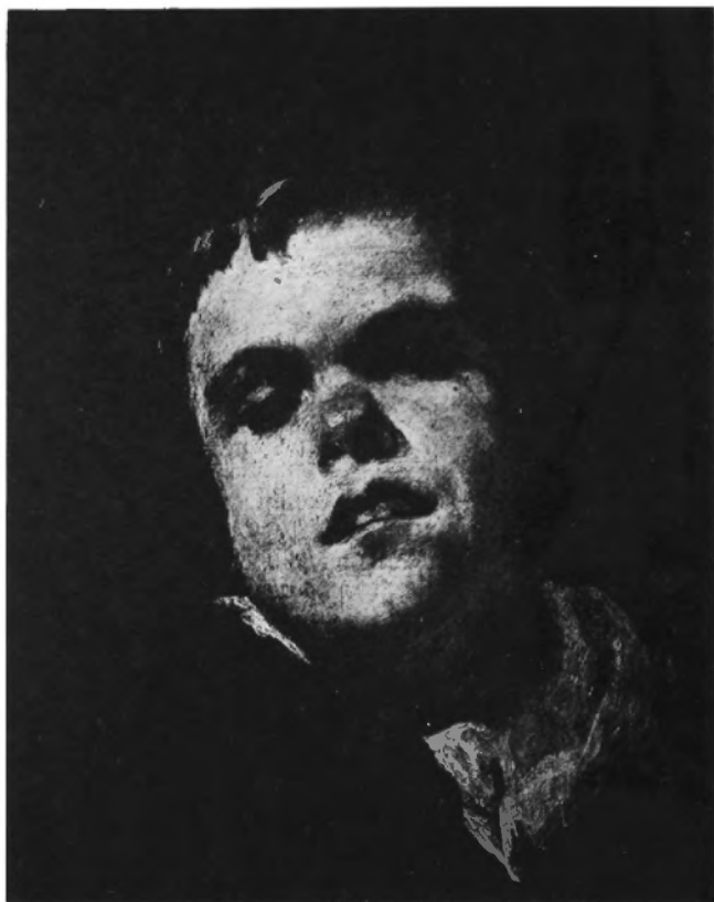
Velázquez: El niño de Vallecas