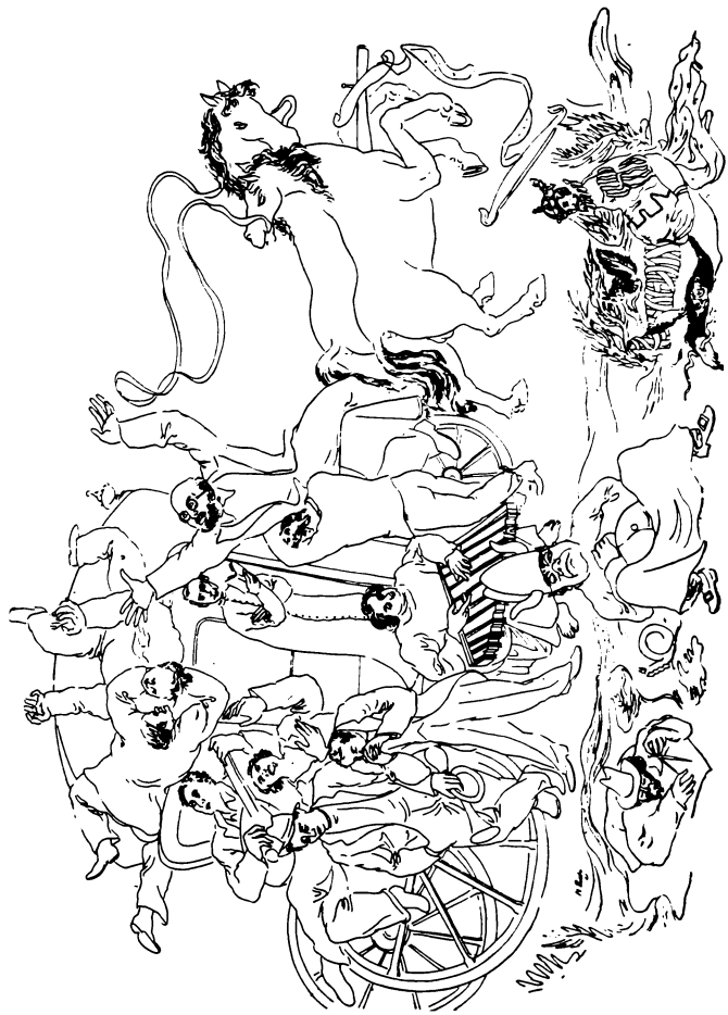
Dibujo de M. Prieto.