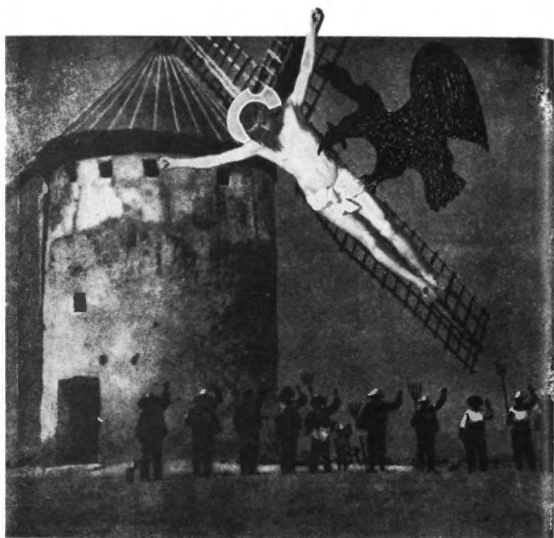
Molino de la Mancha, 1936.

Riman los sueños y los mitos con los pasos del hombre sobre la Tierra.