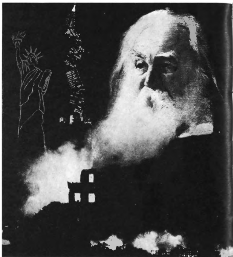
Sacrificio de Guernica, 1937.