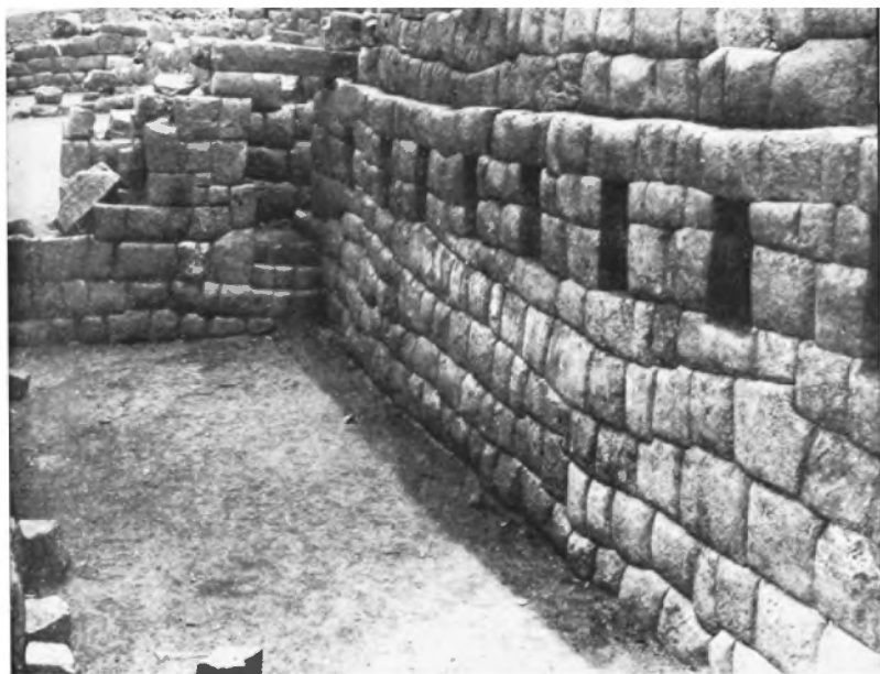
Habitación con portada y hornacinas, en la parte alta y al lado oeste de la ciudadela. Cusco.