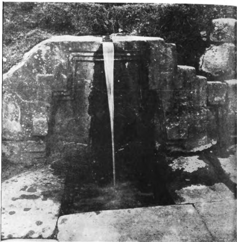
El Baño de la Ñusta, Cusco.