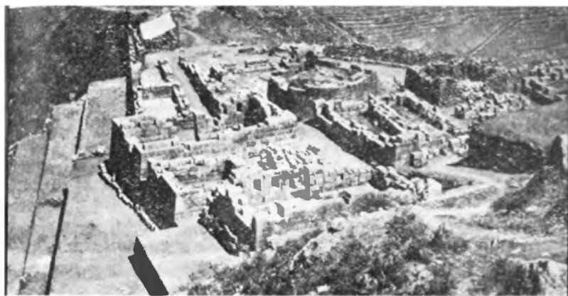
Intihuatana de Pisaj.