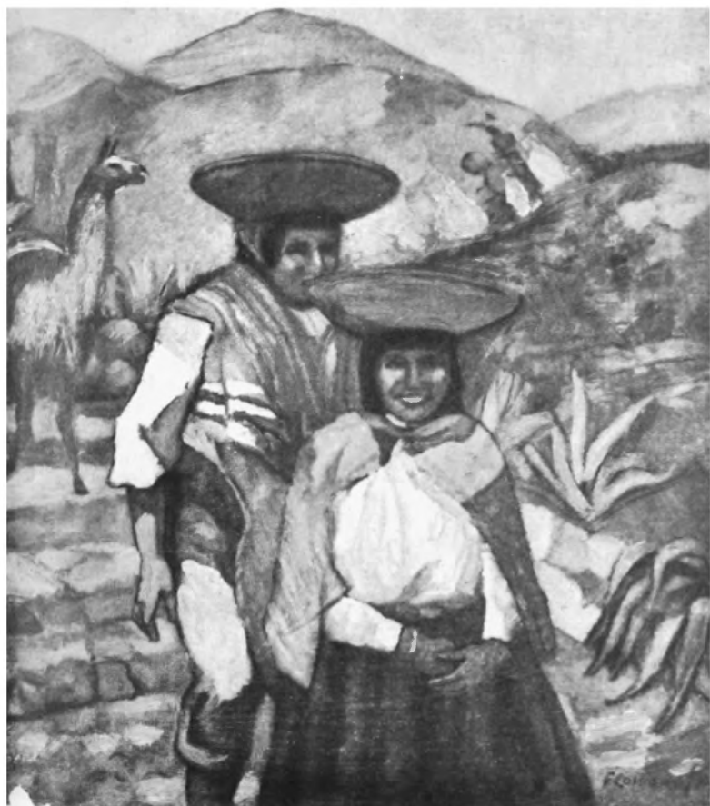
Por los caminos del inka.