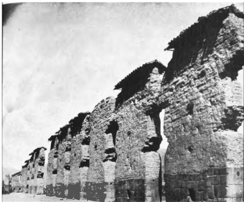
Templo de Wira Kocha (San Pedro), Cusco.