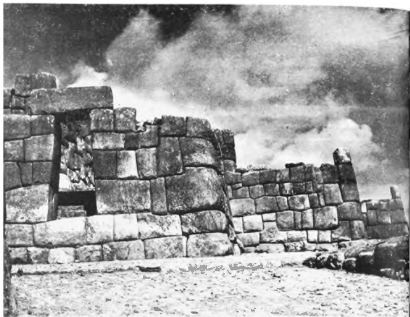
Sajsawaman. Segunda cerca. Cusco.