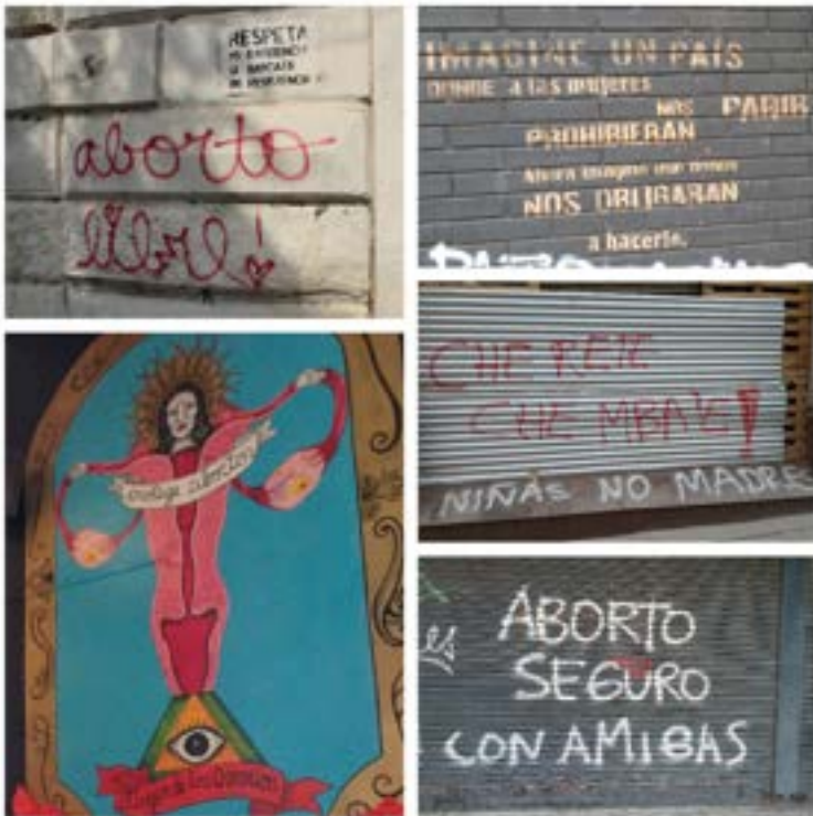
Che rete che mbaè – en guaraní paraguayo: Mi cuerpo es mío.* El mural de la Virgen de los Ovarios es de autoría de Mujeres Creando y se encuentra en la casa Virgen de los Deseos, La Paz, Bolivia.