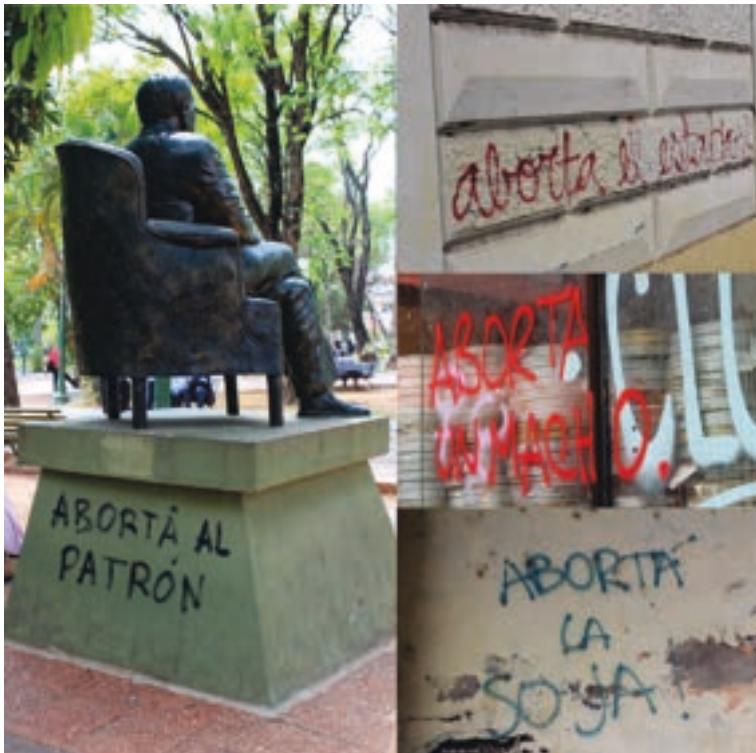
COLLAGE 3. Estado-capital y patriarcado

En este sentido, el feminismo autónomo interpretará la dominación ejercida sobre las mujeres como característica intrínseca