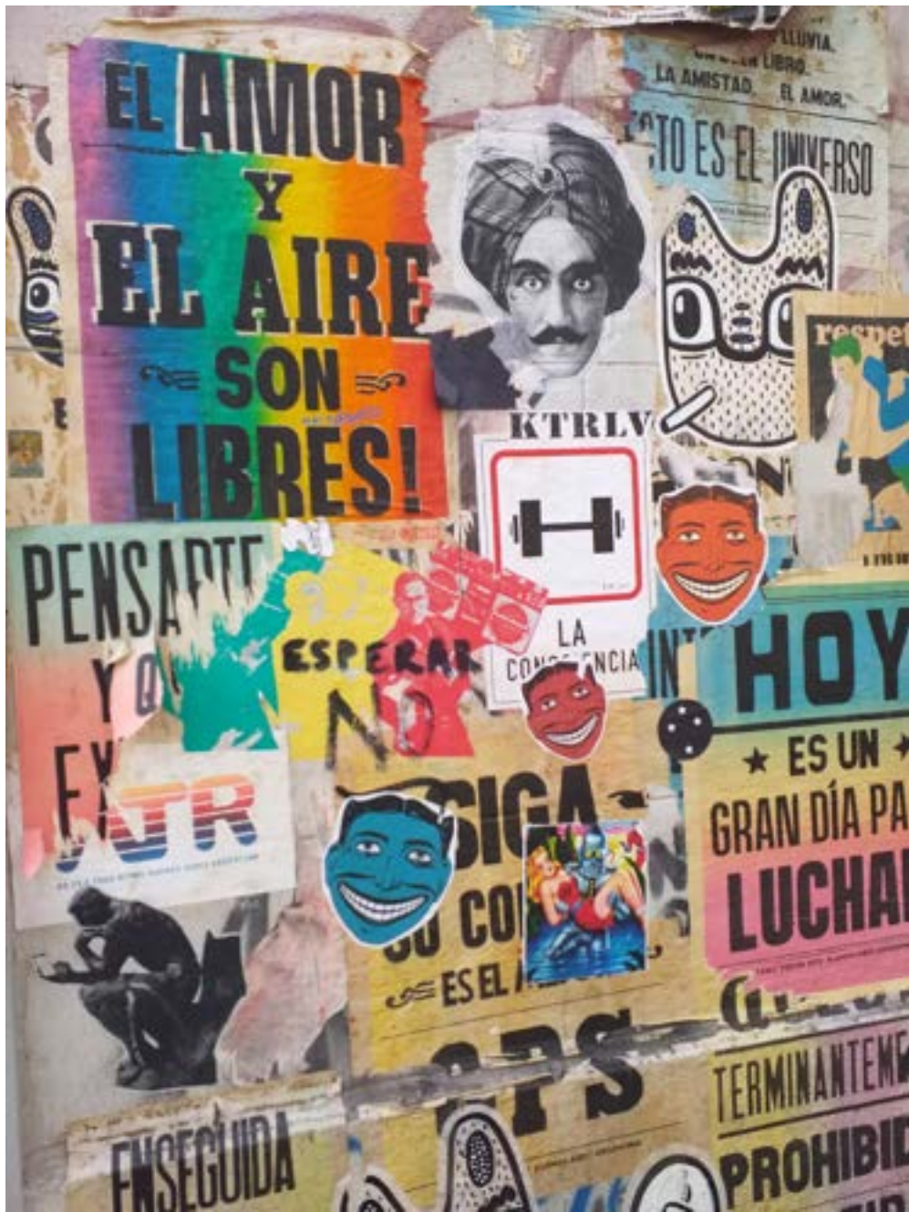
Fuente : pósteres en Buenos Aires, Argentina, foto tomada en julio de 2019. Autora de la foto: Gaya Makaran.