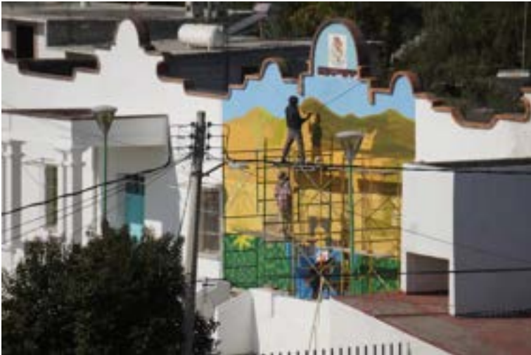
15 de diciembre de 2019.