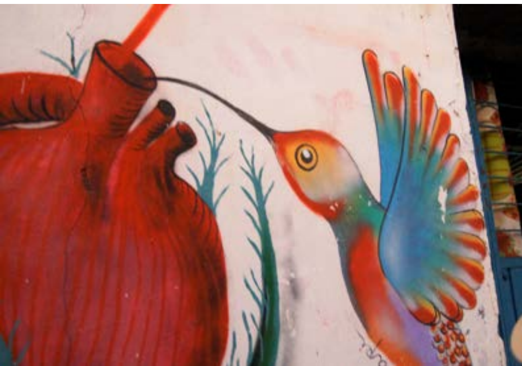
Fuente: grafiti en Amilcingo, Morelos, México, foto tomada en septiembre de 2021. Autor de la foto: Carlos A. Ortega Muñoz.