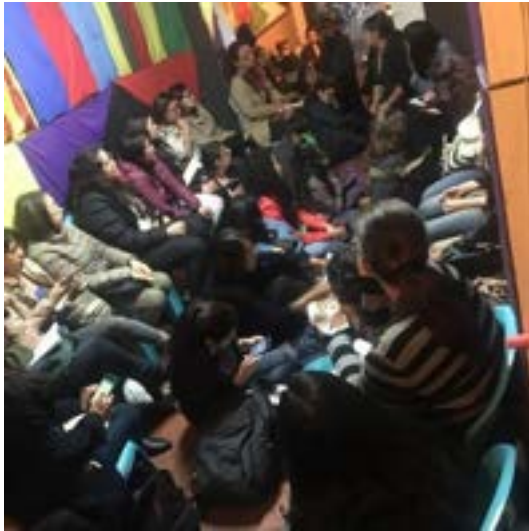
Fotografía 8: Gracias a los encuentros en La Morada logramos lanzar el primer trapo gigante feminista #SomosUnRostroColectivo en la ciudad de Bogotá.