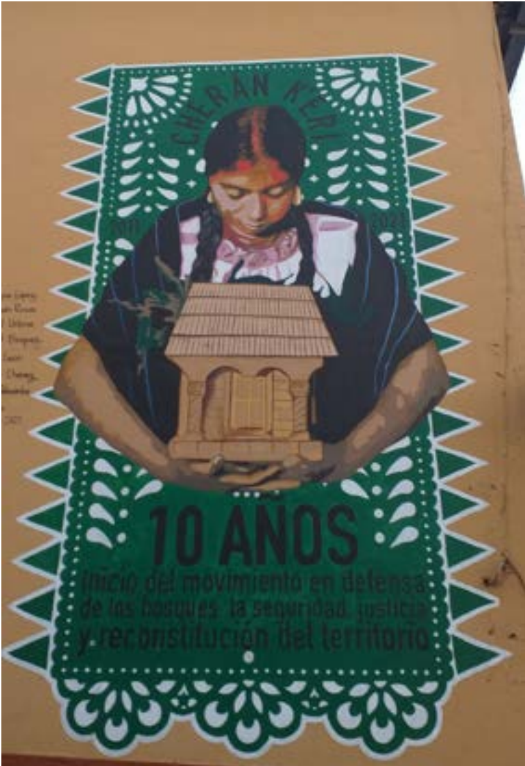
Fuente : póster en una calle de Cherán, Michoacán, México, tomada en noviembre de 2021.