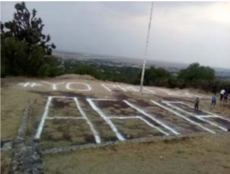
Fuente: fotografía de Esperanza Martínez Hernández, 29 de abril de 2019.