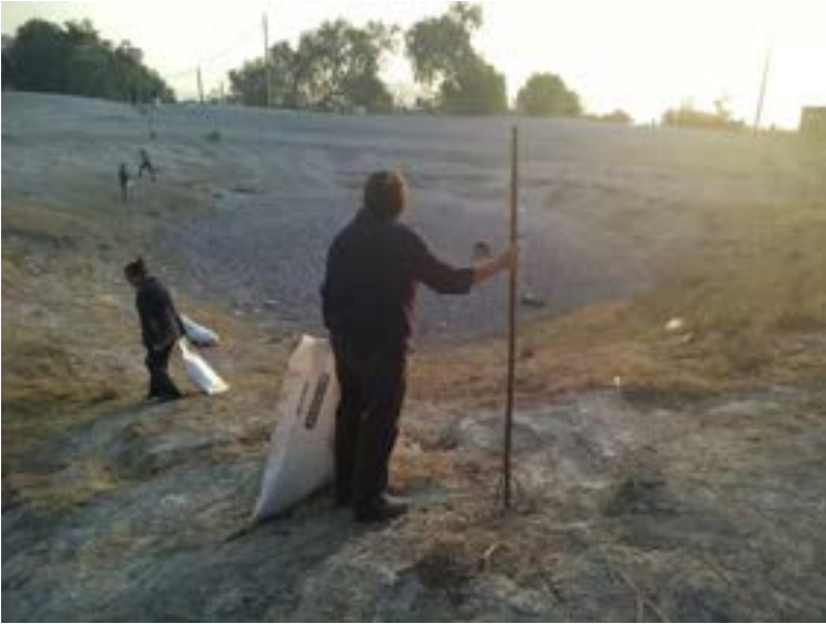
Fotografía 5. Faena para limpiar los jagüeyes de la comunidad de San Pablo Tecalco.

Fuente: Esperanza Martínez Hernández. San Pablo Tecalco, Tecámac, Estado de México. 26 de abril de 2019.