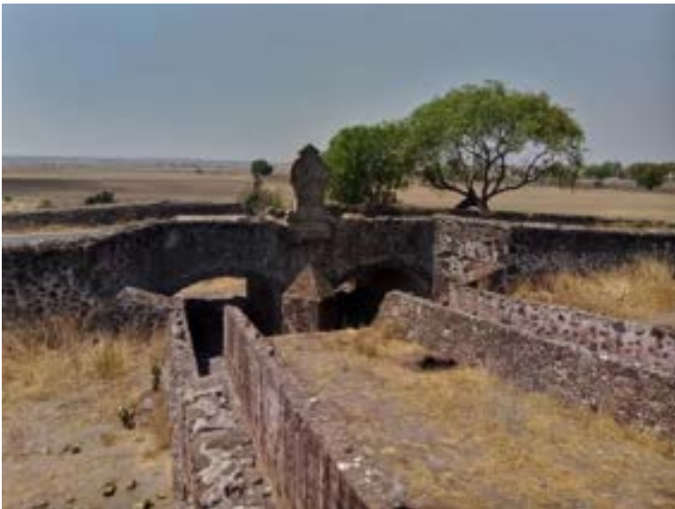
Abril de 2021.

Fotografía 4. La punta del valle del Mezquital está en el Estado de México. Puente colonial sobre la barranca que lleva el cauce desde la Ex Hacienda de El Carmen hacia Hueycoxtila, afluente del río Salado.