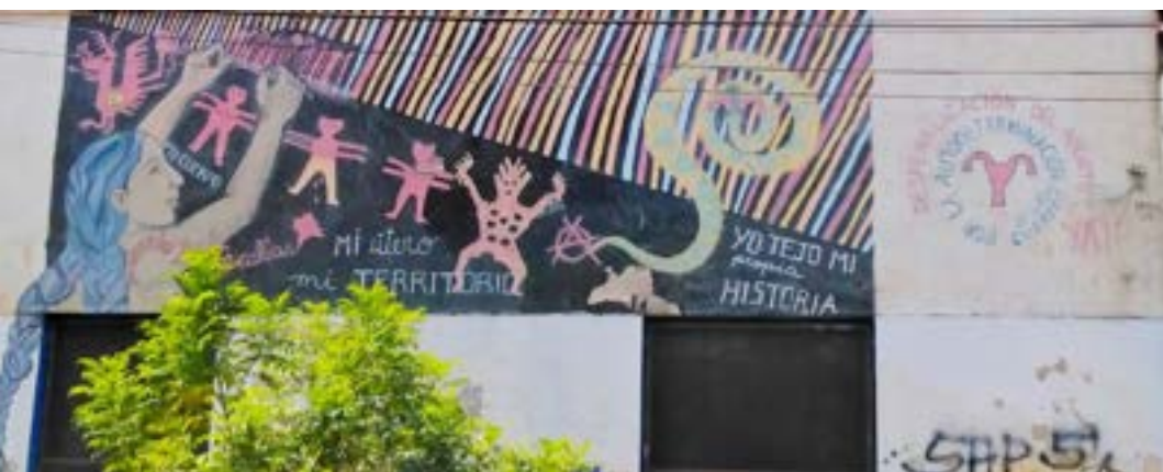
Fuente: grafiti de Laura Liz en la Av. Oquendo, Cochabamba, Bolivia, foto tomada en junio de 2022. Autora de la foto: Denisse Rebeca Gómez Ramírez.