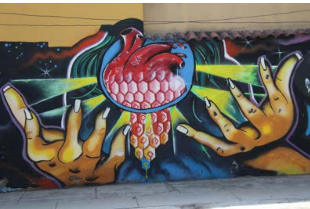
Fuente: grafiti en una de las calles de Cochabamba, Bolivia, foto tomada el 24 de abril de 2017.