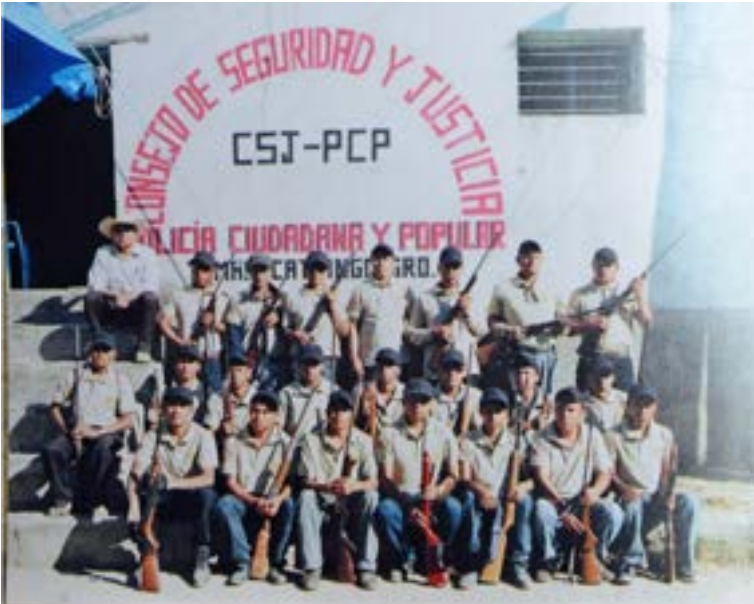
Fotografía 1. Oficina del Consejo de Seguridad y Justicia Indígena pcp. Temalacatzingo, Guerrero