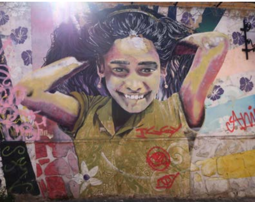
Fuente : grafiti en una de las calles de Valparaíso, Chile, foto tomada el 17 de marzo de 2023. Autora de la foto: Gaya Makaran.