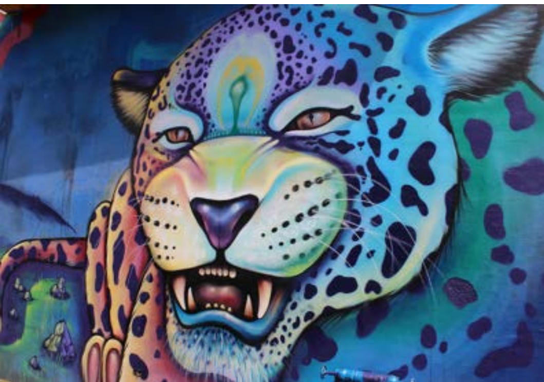
Fuente: grafiti en la calle Juan de O'Leary esq. Presidente Franco, Asunción, Paraguay, foto tomada 17 de octubre de 2019. Autora de la foto Gaya Makaran.