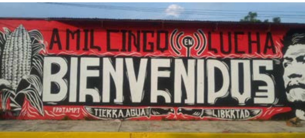
Fuente: grafiti en Amilcingo, Morelos, México, foto tomada en septiembre de 2021. Autor de la foto: Carlos A. Ortega Muñoz.