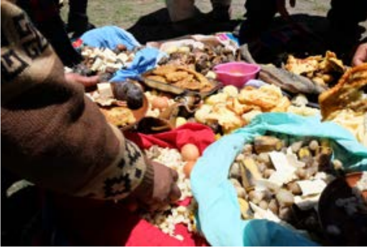
Fuente : tomada por Norihisa Arai, en Agua Blanca, Apolobamba, octubre de 2019.

Las prácticas que determinan la concreción de una actividad específica en torno al trabajo están encaminadas a favorecer la estabilidad comunitaria; con ello, los frutos del trabajo se transforman en bienes que, al ser socializados, se vuelven un medio que garantiza la comunalidad y no en el fin último de la vida, como ocurre en el mundo moderno, en el que el principio de acumulación prevalece como la prioridad económica mayor.