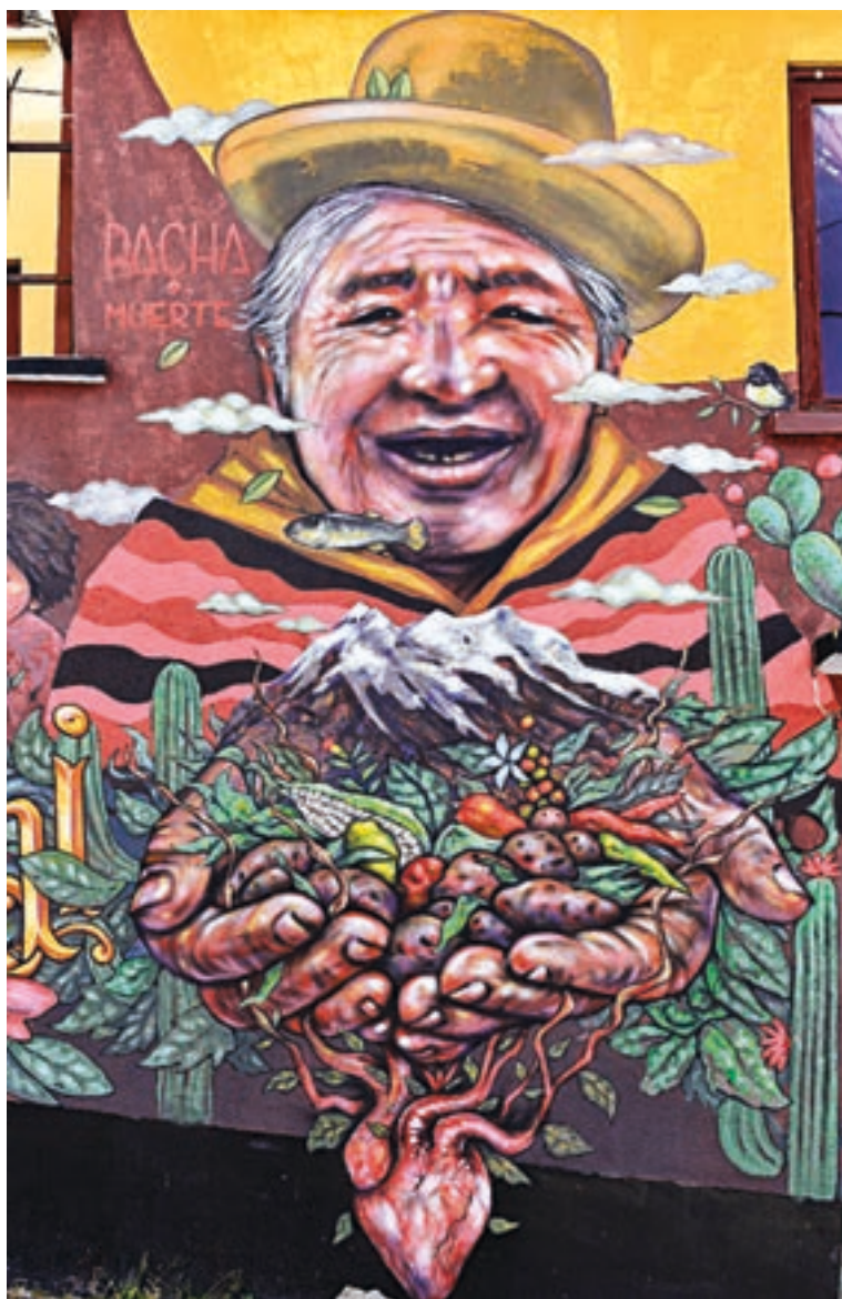
Fuente : grafito de Willka Murales en una de las calles de La Paz, tomada en julio de 2019. Autora de la foto: Gaya Makaran.