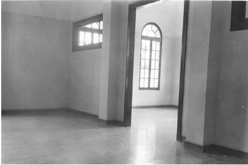
Instalaciones de la embajada republicana en Panamá.