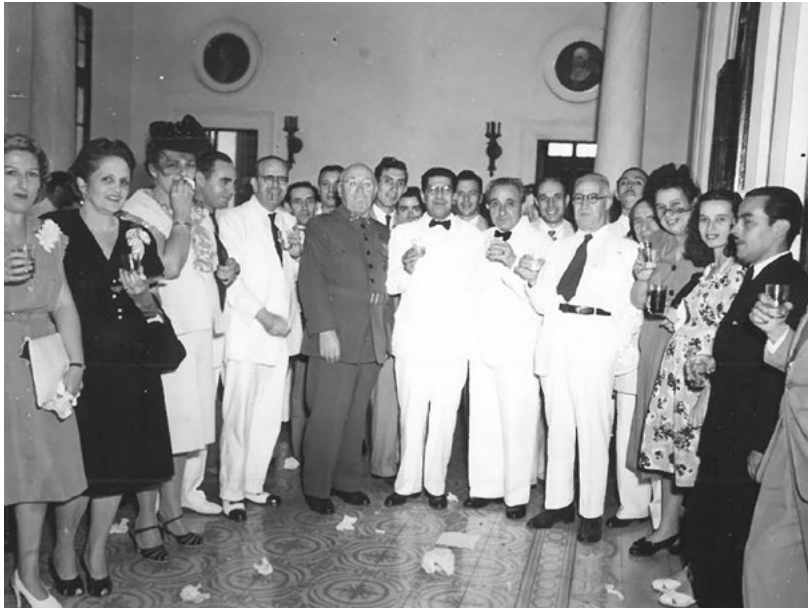
Recepción en la embajada republicana española en Panamá. Al centro, el embajador Gordón Ordás y el general José Miaja y autoridades del gobierno panameño.