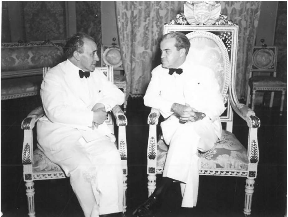
Gordón Ordás y Jiménez Brim en el acto de presentación de credenciales. Salón Amarillo Palacio de Gobierno de Panamá, 7 de diciembre de 1945.