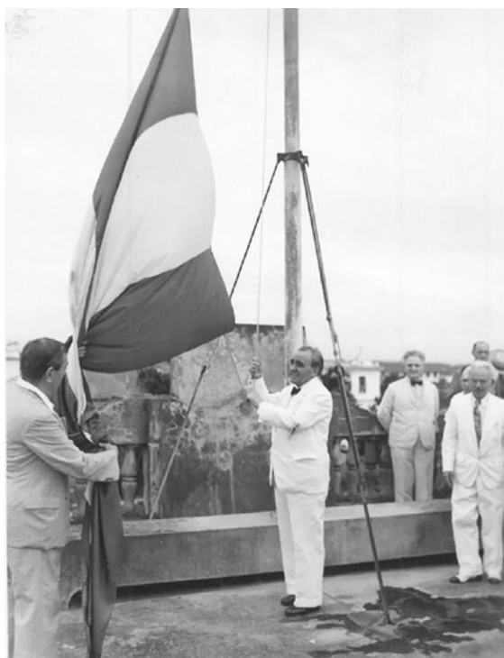
Félix Gordón Ordás en la embajada en Panamá izando la bandera de la República española.

Una vez terminado el triste recorrido por las habitaciones vacías de la Embajada invité al gran número de concurrentes a este penoso paseo, españoles republicanos y panameños amigos de nuestra República, para que me hicieran el honor de subir conmigo y los otros dos miembros de la misión diplomática a la azotea del edificio con el fin de realizar allí la solemne ceremonia de izar la bandera española, lo cual constituyó un acto impresionante. 86