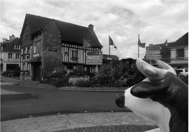
Foto 12. Afiche de promoción de queso artesanal de Neufchatel, expuesto en la vía pública, en el centro del pueblo