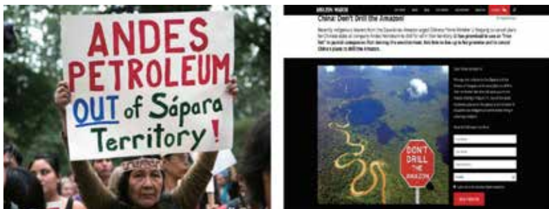
Figura 3. Movimiento social contra inversión de China