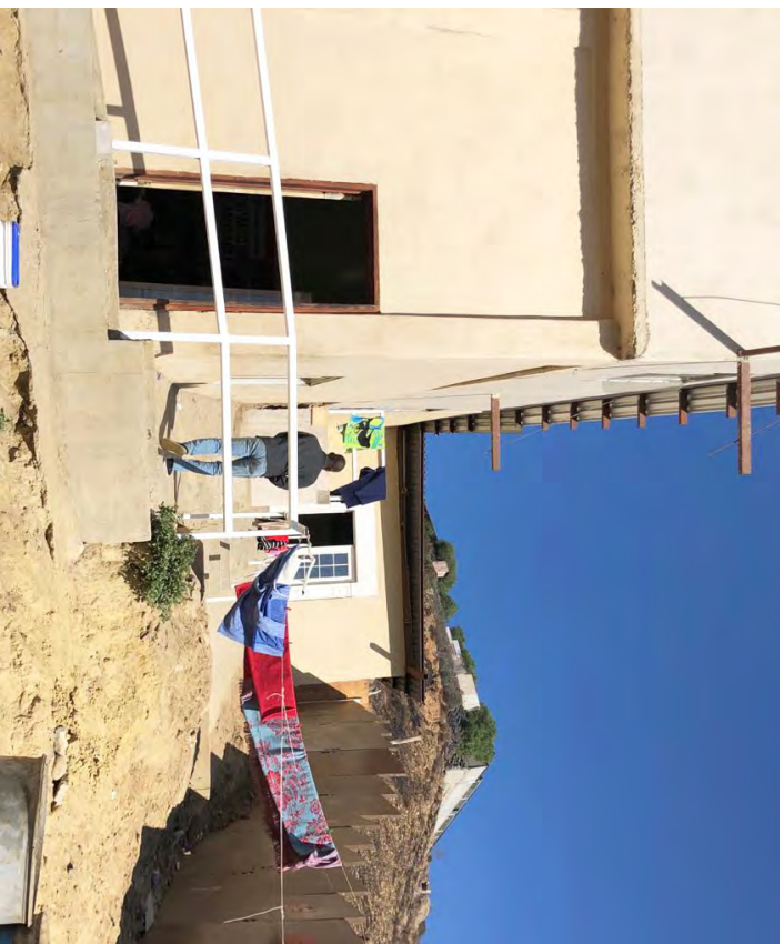
La Pequeña Haití.