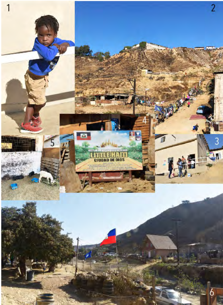
Imagen 1 Little Haiti