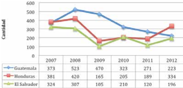
Figura 2. Niños menores de 12 años repatriados desde México según año y país de origen