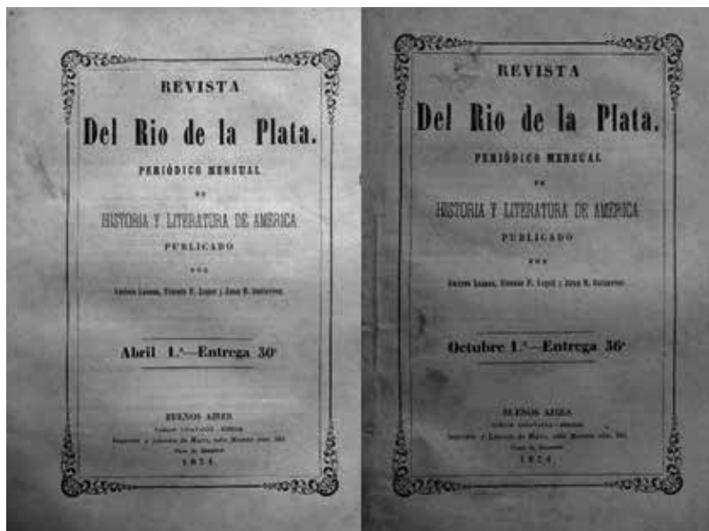
Figura I. Portadas de los números 30 y 36 de la Revista del Río de la Plata