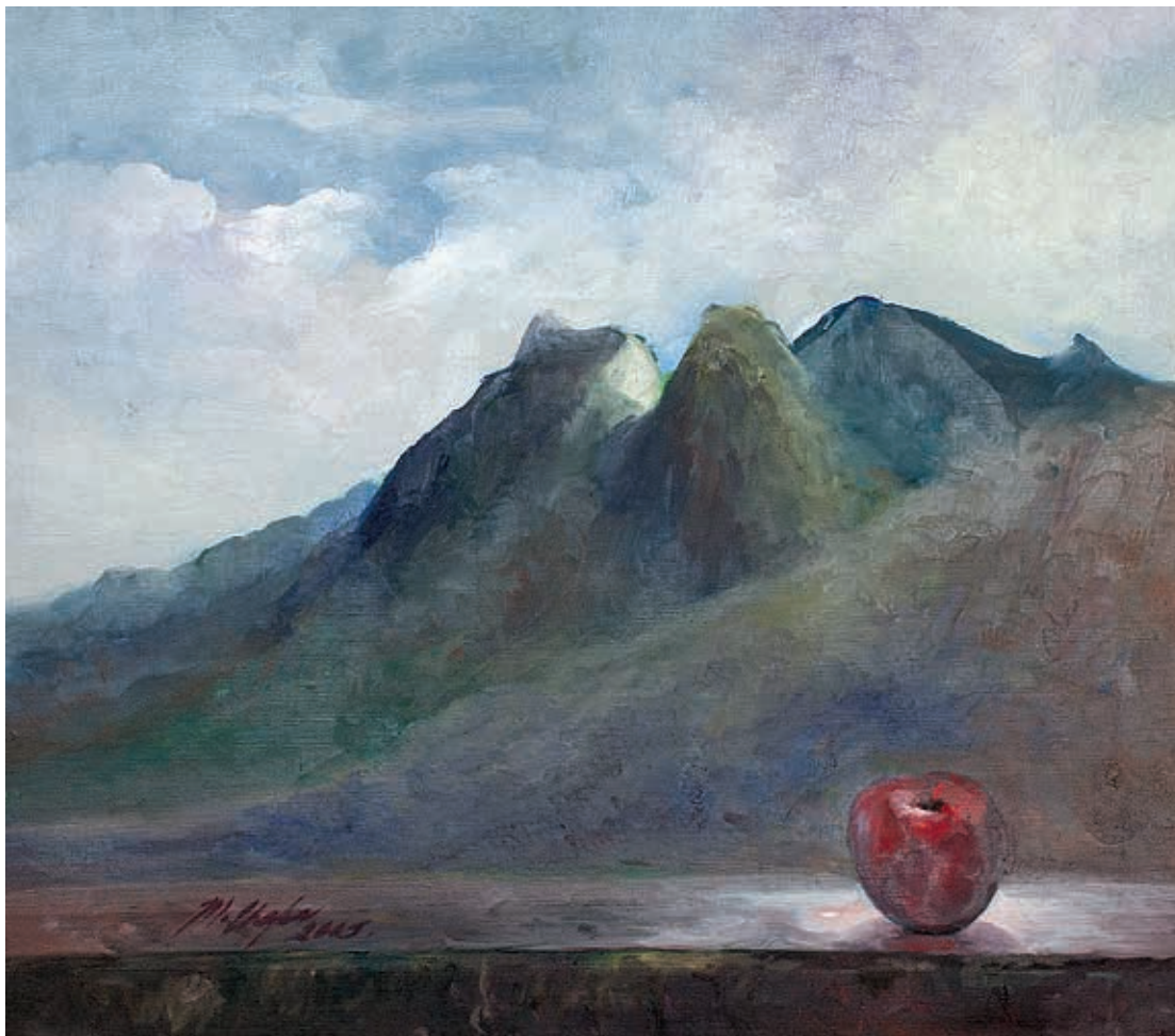
Título: Atardecer de vida Técnica: Óleo sobre tela Medidas: 58 x 66 cm Año: 2005