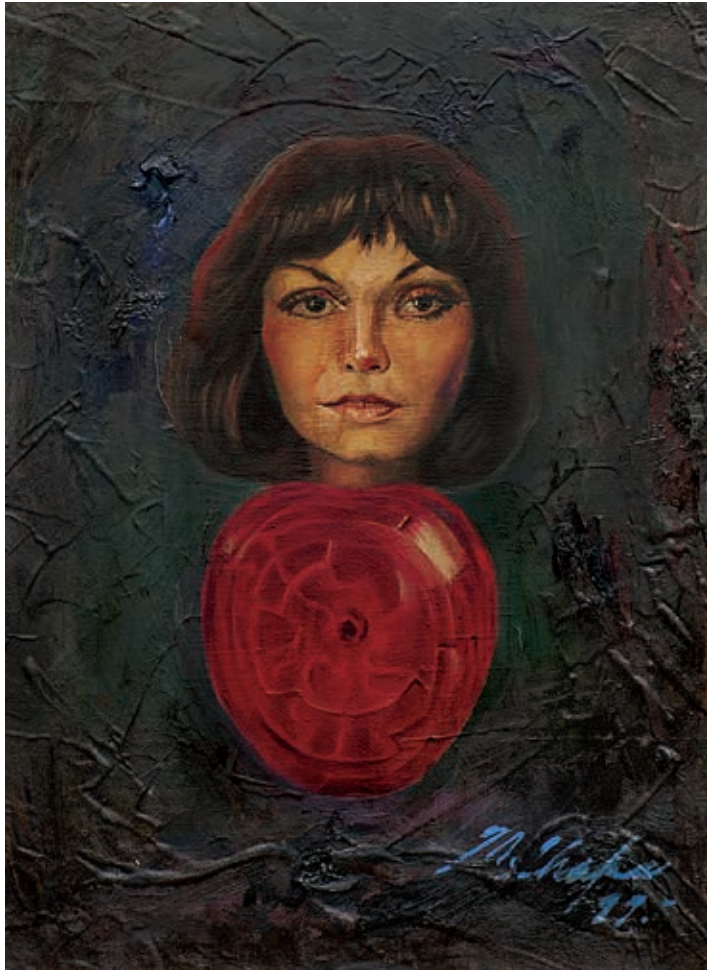
Título: El cuerpo es un rompecabezas Técnica: Óleo sobre tela Medidas: 30 x 40 cm Año: 1999