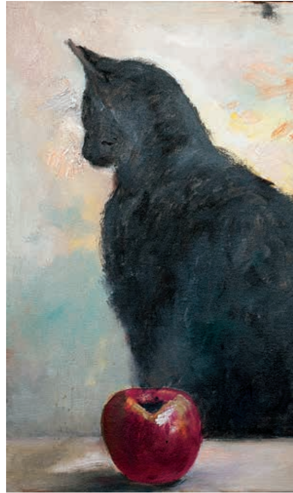
Título: Buenos compañeros Técnica: Óleo sobre tela Medidas: 40 x 50 cm Año: 1999