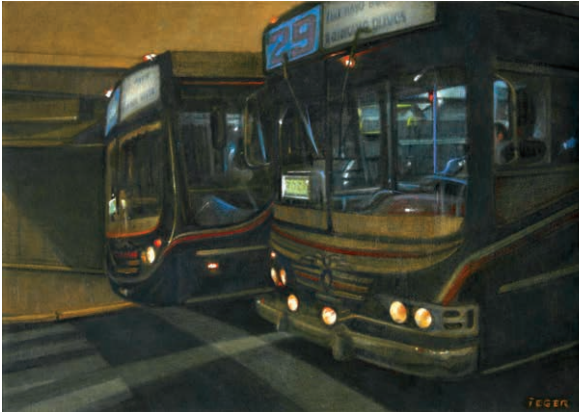
Trasnoche. Óleo sobre tela. 50 x 70 cm