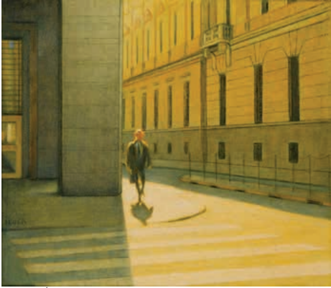
Contraluz. Óleo sobre tela. 40 x 50 cm