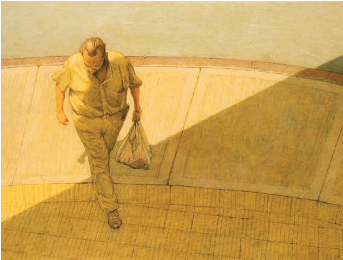
Transición. Óleo sobre tela. 140 x 100 cm