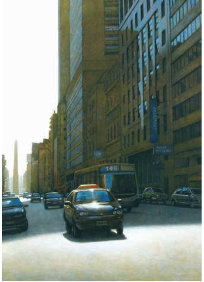
A la luz. Óleo sobre tela. 75 x 105 cm