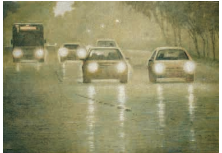
Lluvia. Óleo sobre tela. 100 x 70 cm