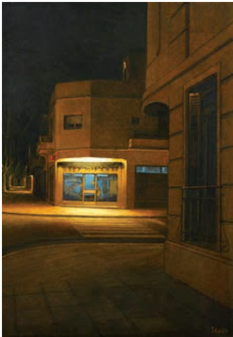
Resplandor. Óleo sobre tela. 70 x 100 cm