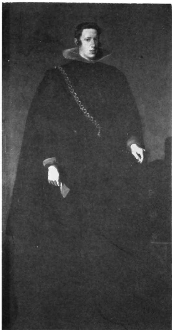
Felipe IV en 1604. Museo Metropolitano de Arte de Nueva York.