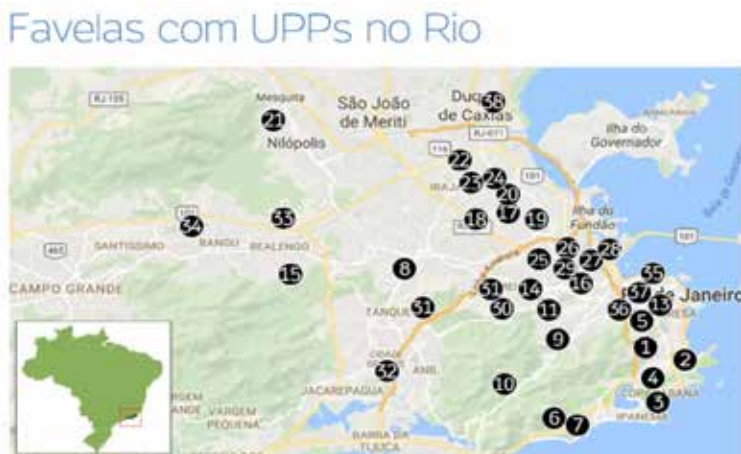
Mapa 4. Unidades de Policía Pacificadora en Río de Janeiro

más que de combatir determinadas actividades ilícitas, de controlar dichas áreas. Aunque el proyecto era contar con 40 instalaciones para 2016, sólo se concretaron 38, la mayor parte de ellas en las zonas norte y sur de Río.