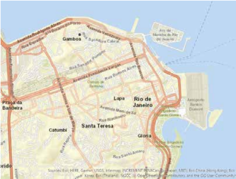
Mapa 1. Zona centro de Río de Janeiro