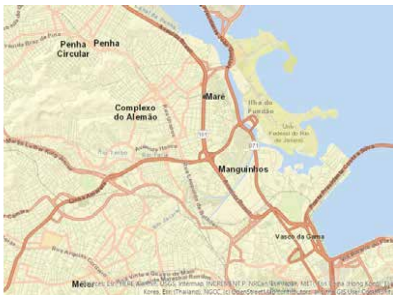
Mapa 3. Zona norte de Río de Janeiro